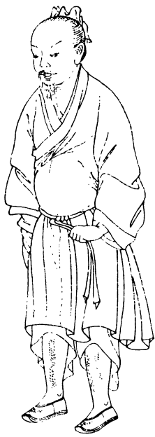
廉瘡生兩腿胆之裏外廉骨