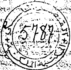
الورقة الأخيرة من نسخة المكتبة الحسينية

انتم في العلم والاعمال في العلم والاعمال في العلم والاعمال في العلم والاعمال في العلم والاعمال في العلم انتم في العلم والاعمال في العلم والاعمال في العلم والاعمال في العلم والاعمال في العلم والاعمال في العلم انتم في العلم والاعمال في العلم والاعمال في العلم والاعمال في العلم والاعمال في العلم والاعمال في العلم