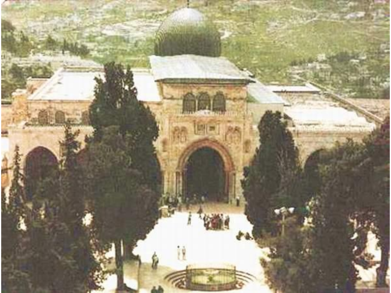
صورة مقربة للمسجد الأقصى