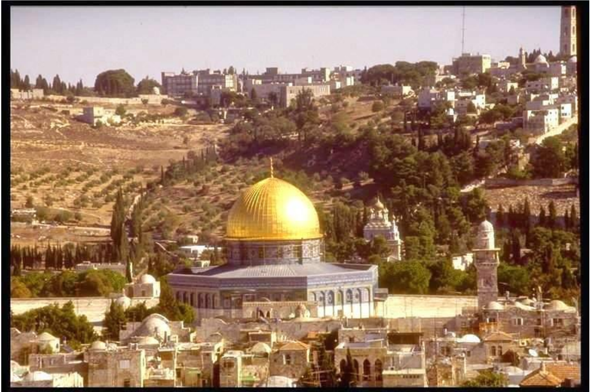
مسجد قبة الصخرة