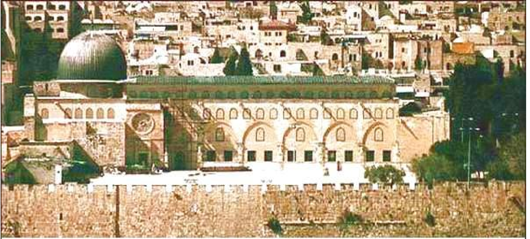
The al-Aksa Mosque