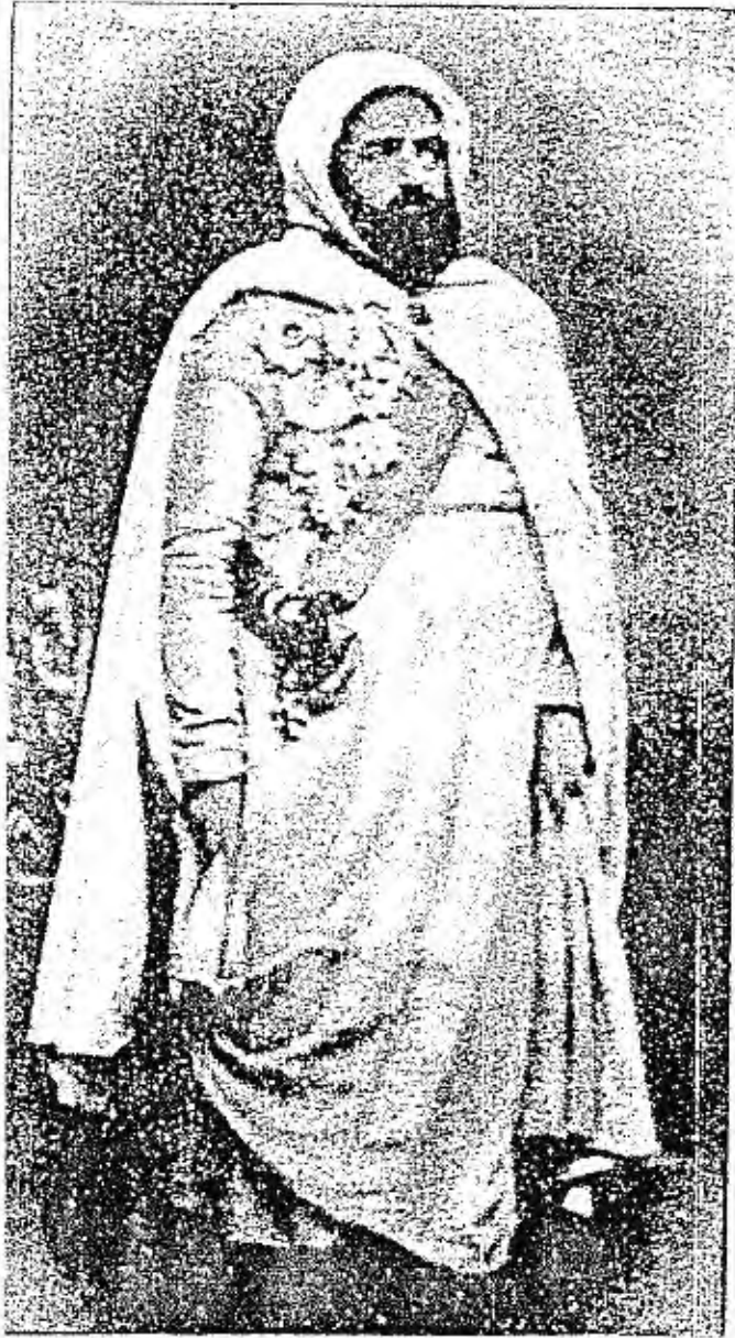
صورة الأمير عبد القادر الجزائري