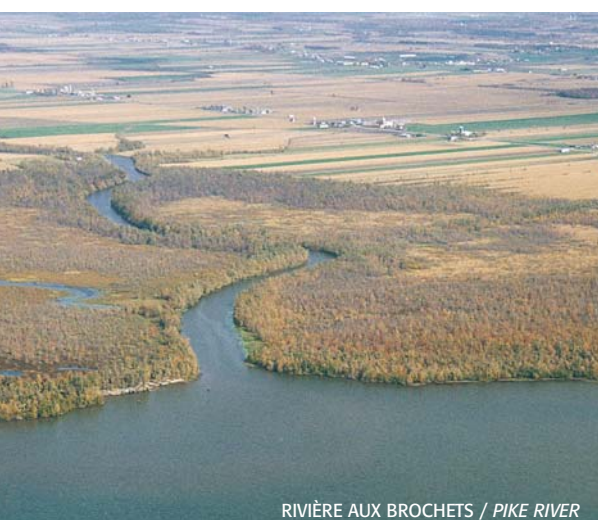
RIVIÈRE AUX BROCHETS / PIKE RIVER