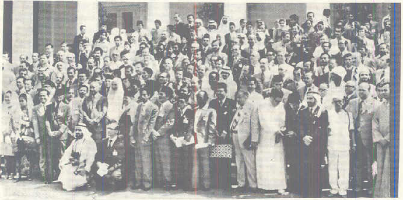
الرئيس الإندونيسي « سوهارتو » يتوسط أعضاء المؤتمر وبينهم أعضاء الوفد المغربي .

وبهذه المناسبة السعيدة فإن صاحب الجلالة الحسن الثاني نصره الله يباشر هذا المؤتمر الموقر أن يوحد خطة لمواجهة الإعلام الإيجابي المفرض على جميع الجبهات وخاصة منه الإعلام الصهيوني في هذه الظروف الدقيقة التي أصبحت فيه إسرائيل تتحدى العالم الإسلامي والعالم الإنساني وأن يتخذ من المقررات الحادة ما يكفل تحقيق النصر النهائي ونحرر القدس الشريف وفلسطين من قبضة الفاصبين كما يسعدني بتكليف من جلالة الملك أن أتقدم بالشكر والامتنان لخزامة رئيس الجمهورية الإندونيسية الجنرال سوهارتو وحكومته الموقرة وشعبه النبيل على ما قبلونا به من عناية واهتمام وما بذلوه في سبيل راحتنا من جهد وعناء والله نسال أن يكمل أعمالنا بالنجاح ويحقق للمسلمين ما يطمحون إليه من عزة وارتقاء .