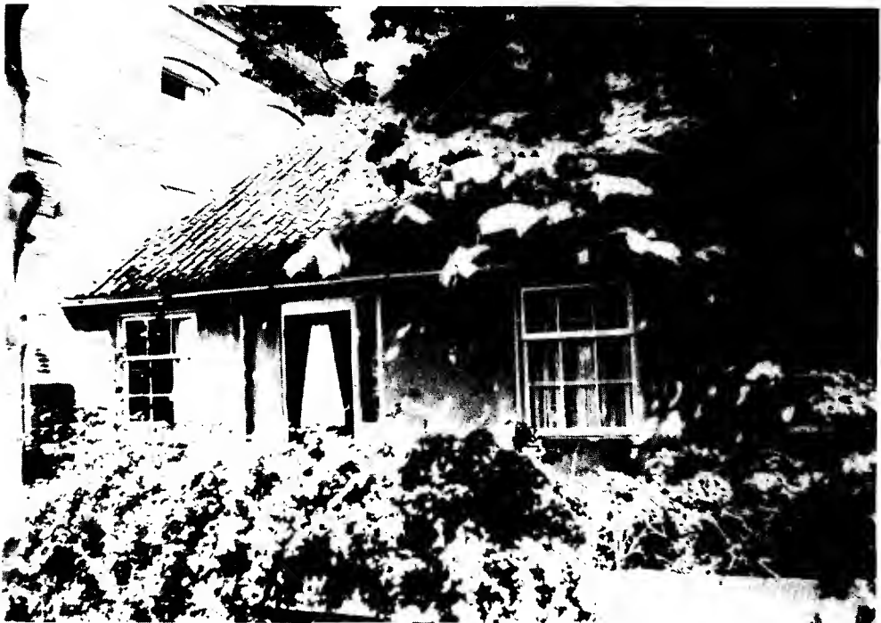
Een stukje van de Apostelwoningen

Voorts zouden twee diakenen met de heer C.A. Gerke gaan spreken ten einde een vermindering van de jaarlijkse rekening voor medicinale hulp te verkrijgen.