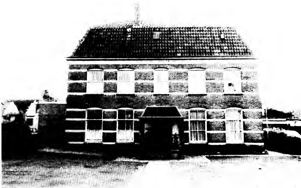
Het Huis heeft weer een naam

Het feit dat het Hervormd Rusthuis aan de Nieuwstraat 10 in het dorp nog vaak werd aangeduid met "Diaconiehuis", was voor het bestuur aanleiding te overwegen om aan het Huis een naam te verbinden.