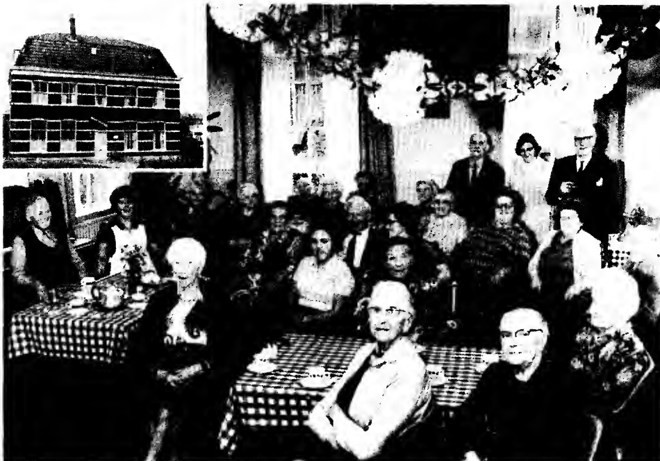
Feestdag nadat besloten is de sluiting van het Huis nog enige jaren uit te stellen.