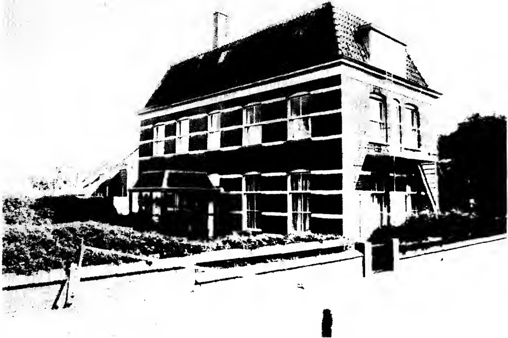
De brandtrap aan de westzijde