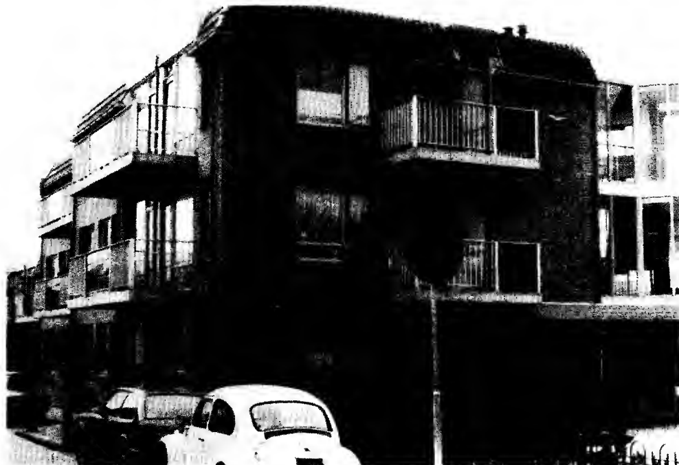
Voor- en zij aanzicht van het complex Hulsmanhof

Maar ook een aangrijpend moment omdat de naam Hulsmanhof, die zo nauw verbonden was met de straatnaamaanduiding Nieuwstraat 10, voor de toekomst