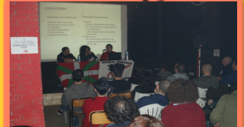
Ikasle Abertzaleak Italian