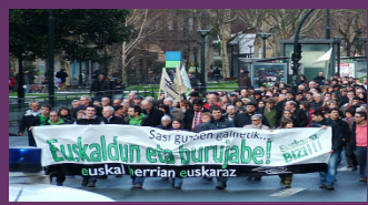
Sasi guztien gainetik...