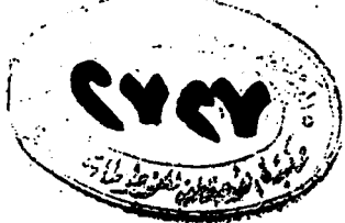
صورة الصفحة الأخيرة من الرسالة

وصلى الله على سيدنا محمد وآله وصحبه وسلم وصلى الله على محمد وآله وصحبه وسلم