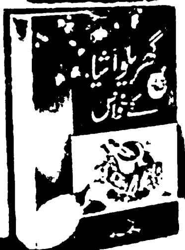
Gharelu Ashiya ke Khwas