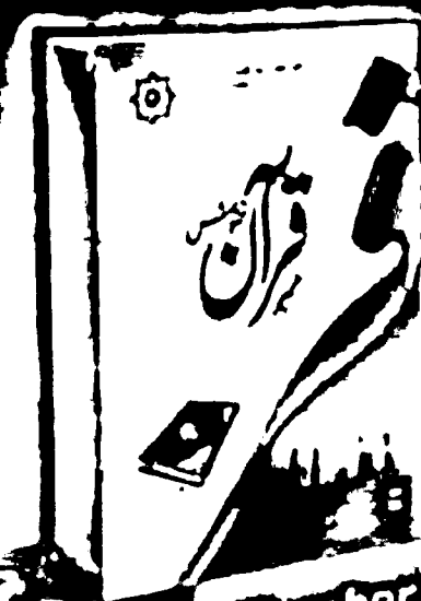
Quran Number Set in 4 Vol.