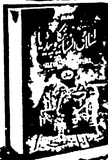
Islami Encyclopedia Set in 2 Vol.