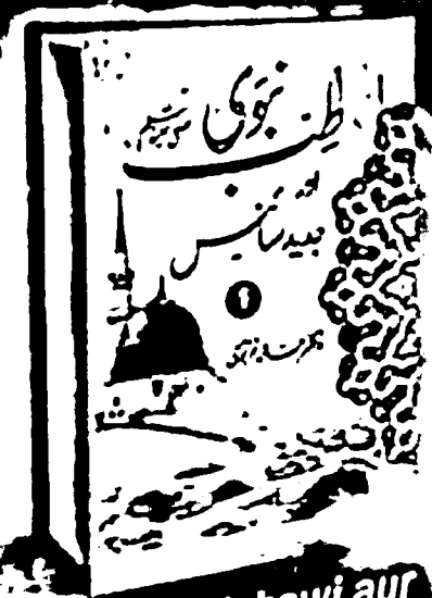
Tibbe Nabawi aur Jadeed Science Set in 2 Vol.