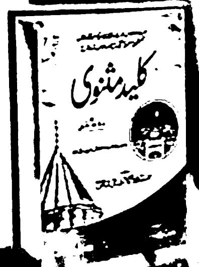
Kaleed Masnavi Set in 5 Vol.