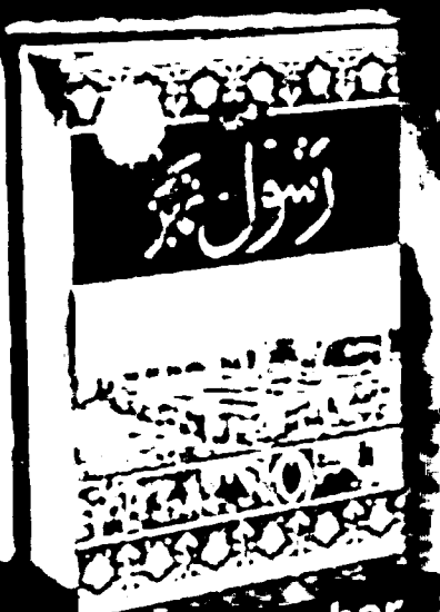
Rasool Number Set in 13 Vol.