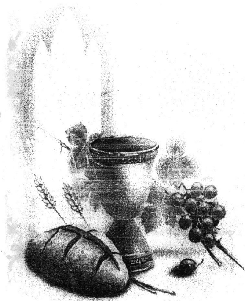
MISSA DA PRIMEIRA COMUNHÃO