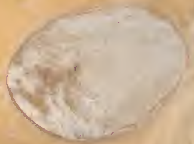
Figure 2 C. ... ..

cm 1 2 3 4 5 6 7 8 9 10 11 12 13 14 15 16 17