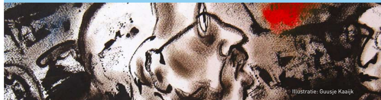
Illustratie: Guusje Kaaijk