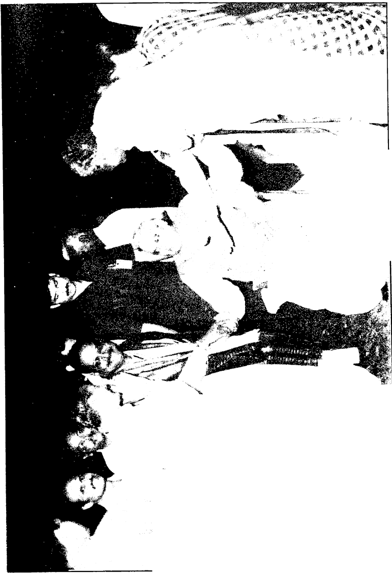
3 నివాసం న్యూఢిల్లీలో ర శ్రీ అటల్ బిహారి వాజ్