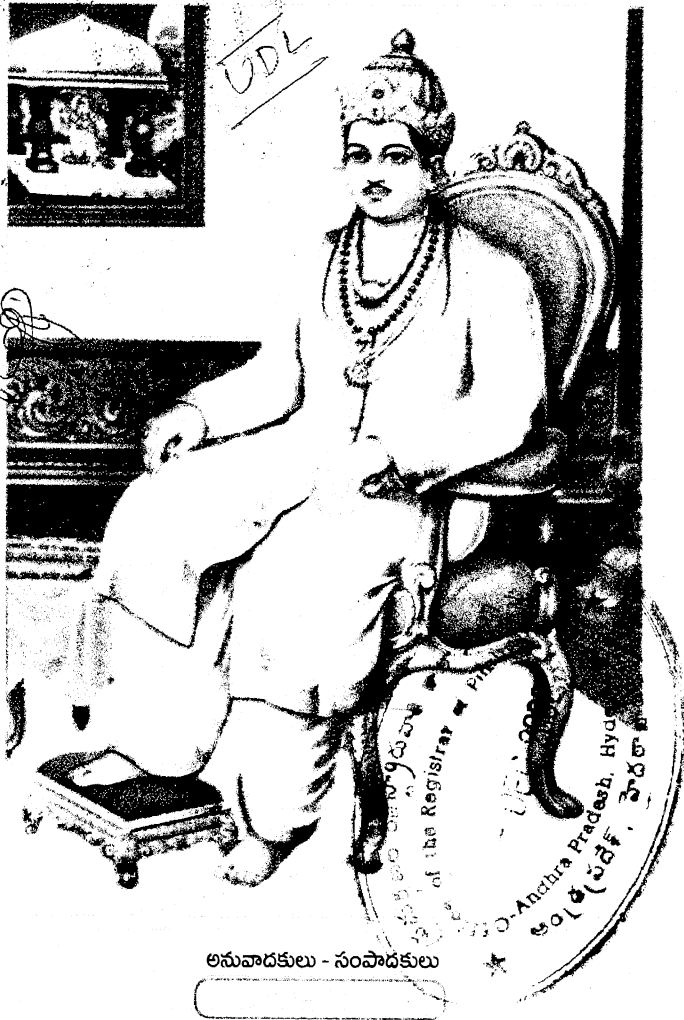
అనువాదకులు - సంపాదకులు

ప్రచురణ : డాక్టర్ శ్రీరాములు తెలుగు విశ్వవిద్యాలయం, హైదరాబాద్, ఆంధ్రప్రదేశ్. 2001