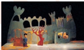
“La princesa de fresa”.