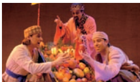
“1001 Una odisea en el desierto”