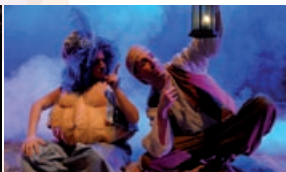
“Genio de la lámpara”.