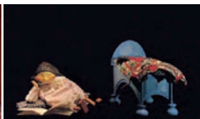
“La princesa de fresa”