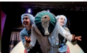
“Me duele el caparazón”.