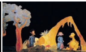
“La princesa de fresa”.