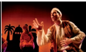
“1001 Una odisea en el desierto”.