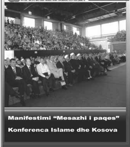
Manifestimi "Mesazhi i paqes" Konferenca Islame dhe Kosova