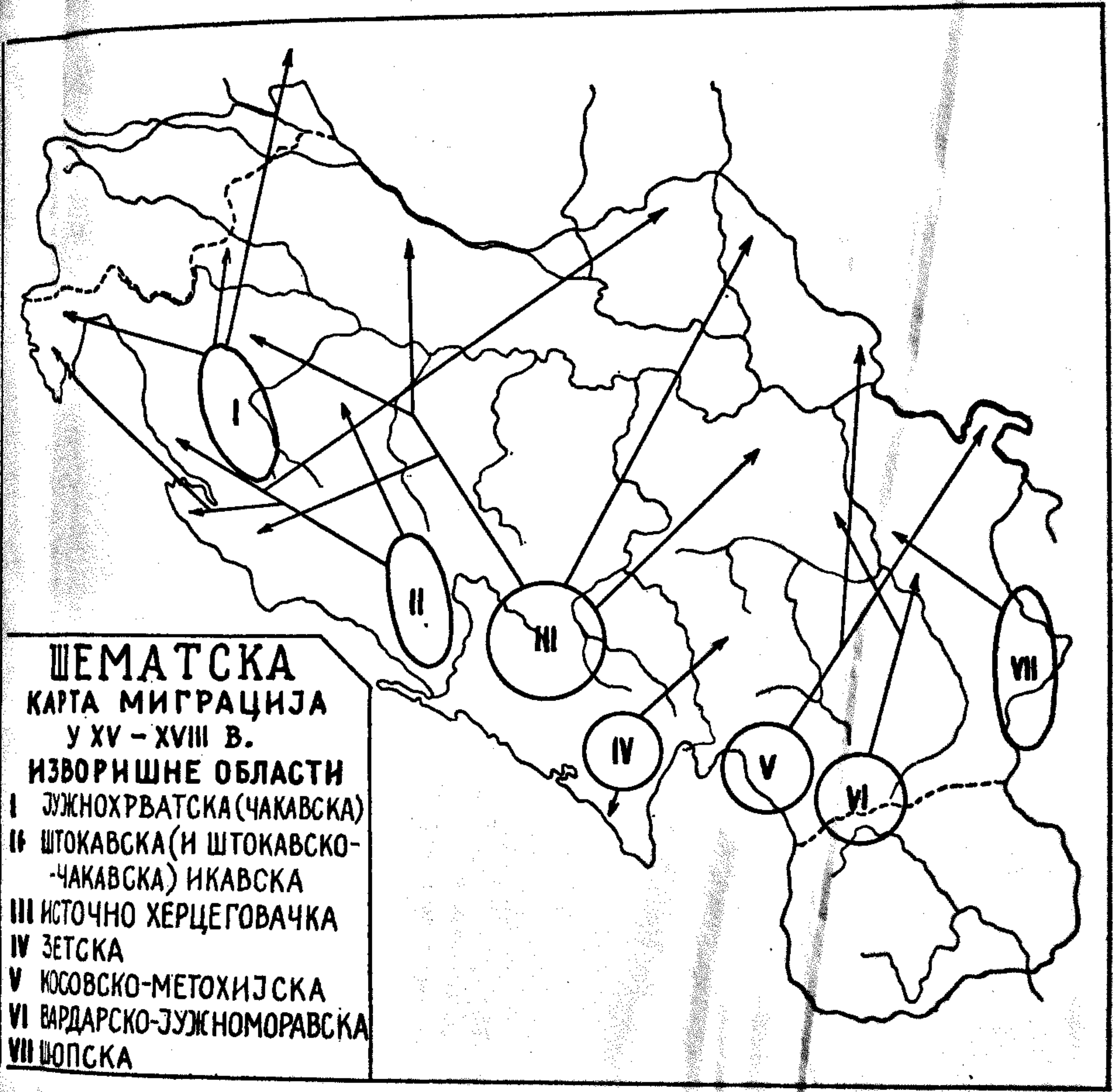
ШЕМАТСКА КАРТА МИГРАЦИЈА У XV - XVIII В. ИЗВОРИШНЕ ОБЛАСТИ I ЈУЖНОХРВАТСКА (ЧАКАВСКА) II ШТОКАВСКА (И ШТОКАВСКО- ЧАКАВСКА) ИКАВСКА III ИСТОЧНО ХЕРЦЕГОВАЧКА IV ЗЕТСКА V КОСОВСКО-МЕТОХИЈСКА VI ВАРДАРСКО-ЈУЖНОМОРАВСКА VII ШОПСКА