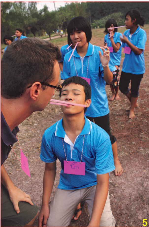
1. กิจกรรมนันทนาการสร้างความสัมพันธ์ 2. สุขใจในค่ายเยาวชนกับกิจกรรมรักษ์แม่น้ำโขง 3. เยี่ยมเยือนผู้สูงอายุในหมู่บ้าน 4. กิจกรรมฐานเสริมสร้างความสามัคคี 5. กิจกรรมหาของที่ต้องใช้ทั้งความคิดและความเร็ว