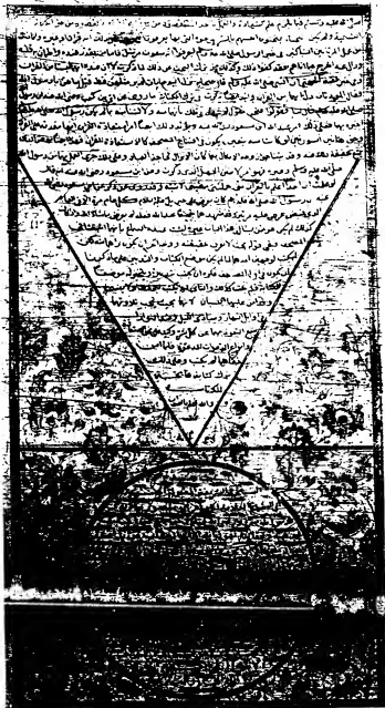
صورة الصفحة الأخيرة من نسخة دار الكتب المصرية