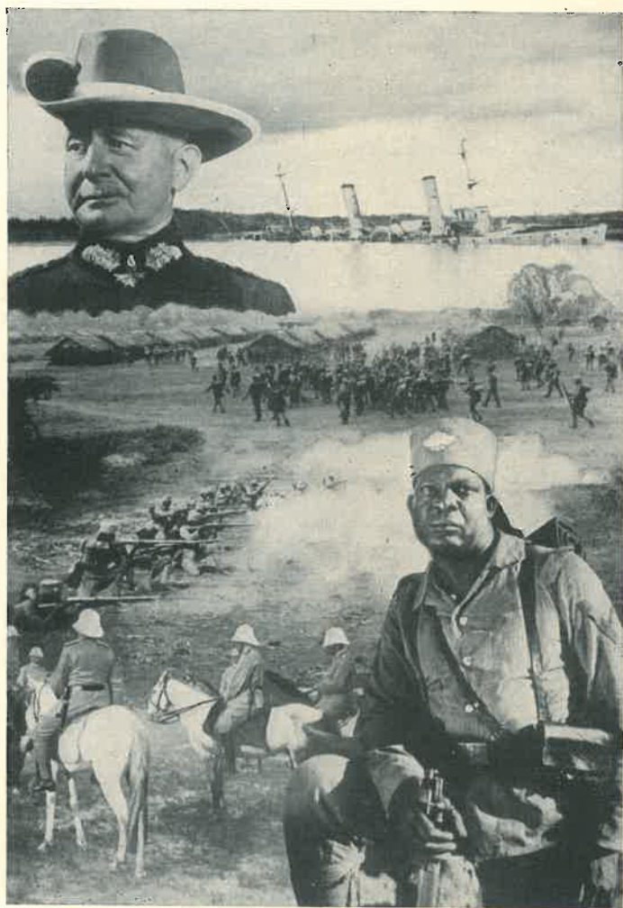
Die unbesiegte Schutztruppe Ostafrikas mit ihren treuen Askaris und ihr Kommandeur v. Lettow-Dorbeck. S.M.S. „Königsberg“ im Rufidji-Delta