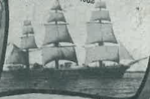
SMS „STOSCH“ 1882