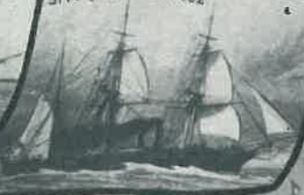
SMS „CAROLA“ 1882