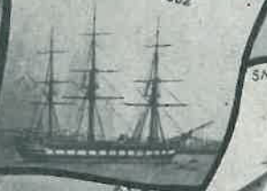
SMS „ELISABETH“ 1882