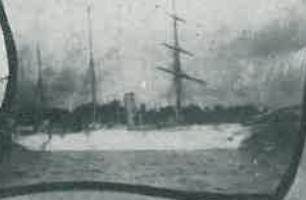
SMS „HABICHT“ 1881