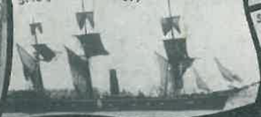
SMS „AUGUSTA“ 1877