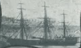
SMS „NYMPHE“ 1872