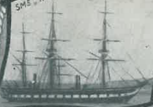
SMS „HERTHA“ 1876