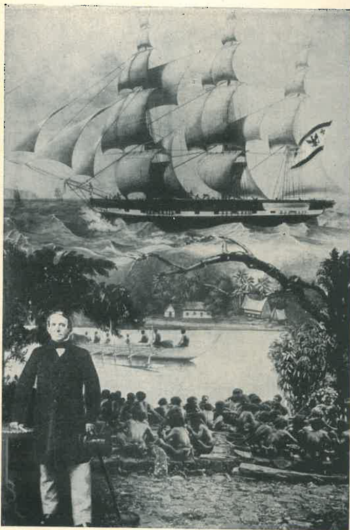
Johann Cesar Godeffroy, der „König der Südsee“ und eine seiner Faktoreien. Oben ein Schiff der Preussischen Seehandlung, die „Prinzess Luise“