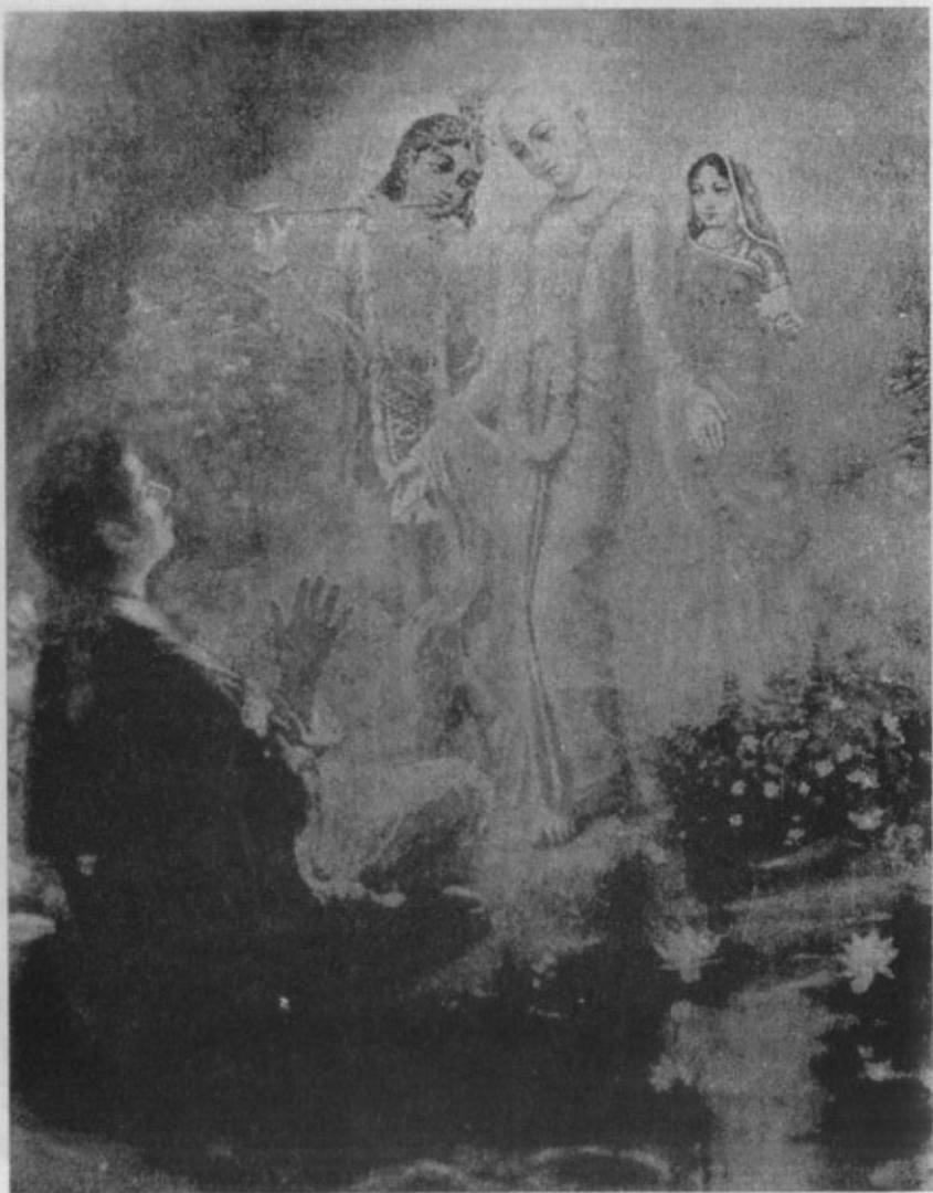
રામાનંદ રાયને શ્રી ચૈતન્ય મહાપ્રભુમાં રાધા અને કૃષ્ણનાં દર્શન થાય છે. એની વિગતવાર સમજૂતી પાન નં. ૪૯-૫૦ ઉપર છે તે વાંચશો.