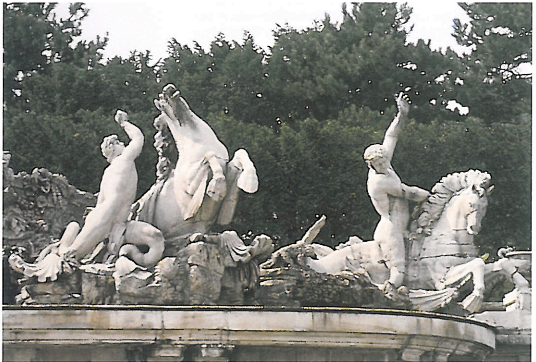
En haut, à droite et ci-contre : 5 et 6 Bassin de Neptune. Ensemble et détail. Parc de Schonbrunn.

vement de la queue du cheval est un peu maladroit : il s'agit d'un remontage ancien (repris en 1941 11 , puis en 1969) qui ne rend pas justice à la fluidité de la ligne observable sur l'exemplaire américain. Les deux antérieurs du cheval, conservés jusqu'aux genoux sur le groupe du Louvre ont entièrement disparu sur celui de Seattle (fig. 3). Ils ont été restaurés anciennement sur notre esquisse, en terre cuite, mais malheureusement les canons et les sabots sont un peu grêles, ce qui ôte de la force à l'image du cheval dressé. Les sabots étaient d'ailleurs probablement palmés comme ils le sont dans les sculptures du parc. La dernière restauration 12 , qui visait surtout à améliorer l'aspect de la pièce, a permis de mieux comprendre ces restaurations anciennes, et de procéder à l'analyse des terres utilisées, celle de l'esquisse et celle des intégrations (cf. infra annexe).