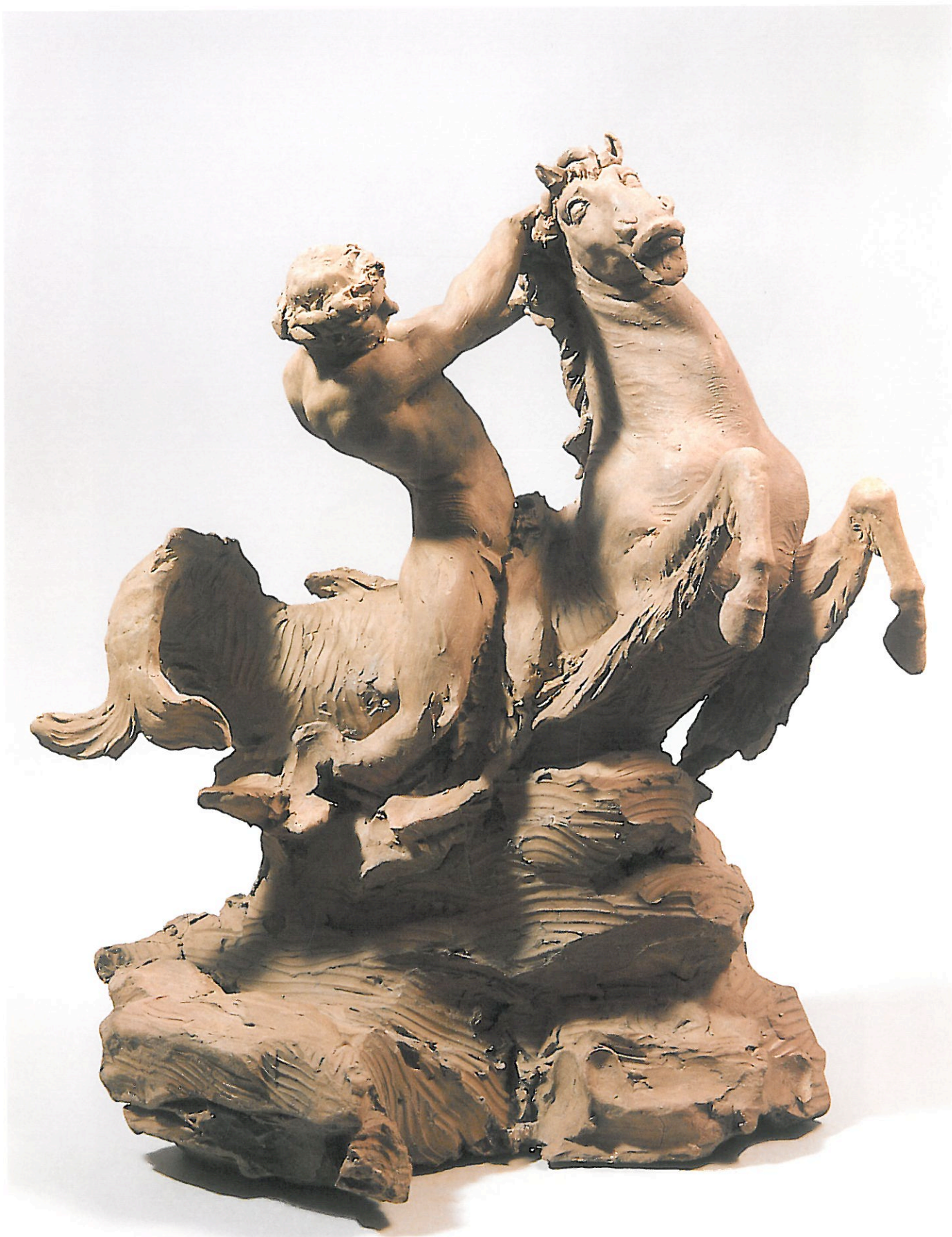
1 Wilhem Beyer. Triton et cheval marin . Esquisse. Terre cuite. Paris. Musée du Louvre. Département des Sculptures. RF 2323.