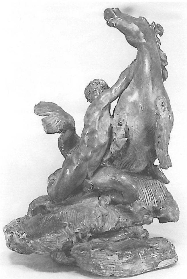
3 Wilhem Beyer. Triton et cheval marin . Esquisse. Terre cuite. Seattle. Art Museum.

Le point culminant du parc et de son programme iconographique est la Fontaine de Neptune 8 , réalisée après le reste de la sculpture du parc, à partir de 1780. Au centre, Neptune et Thétis, flanqués de Triton et Protée, sont accompagnés d'autres créatures