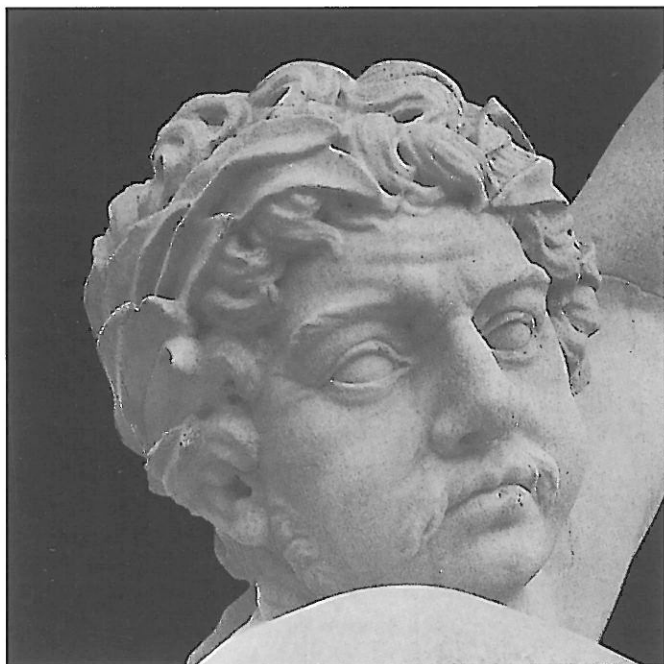
7 Sur un modèle de Beyer. Triton. Marbre. Parc de Schönbrunn.

d'évoquer au musée du Louvre la sculpture des pays germaniques pour l'époque moderne. Nos collections sont traditionnellement pauvres en sculpture étrangère de cette période, et nous le regrettons. Mais les hasards des legs ou des donations ont fait souvent entrer dans les musées des objets inattendus, et il reste encore de belles trouvailles à faire dans ce domaine 16 .