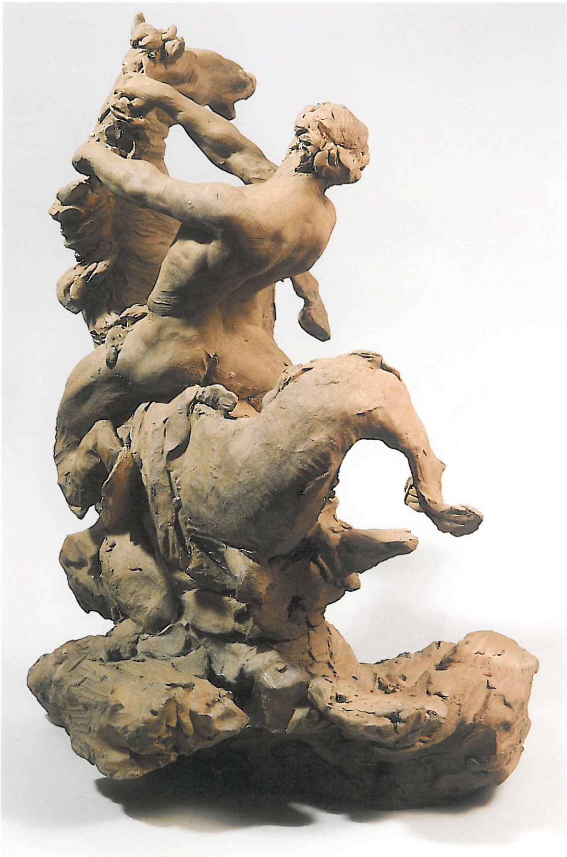
2 Wilhem Beyer. Triton et cheval marin . Vue de dos. Esquisse. Musée du Louvre. Département des Sculptures. RF 2323.