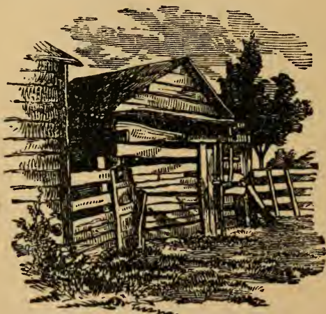
Lincoln's früheste Heimath in Kentucky.

haus errichten wollten. Auch Abe erhielt eine Art; und mit dem weitem Beistand eines Nachbars hatte Lincoln in zwei bis drei Tagen ein zierliches Haus von etwa achtzehn Quadratsfuß, dessen Balken in der üblichen Weise durch Knoten befestigt waren, während die Lücken zwischen denselben mit Lehm ausgefüllt waren. Es hatte bloß Ein Zimmer; doch gaben einige oben über Balken gelegte Bretter weitere Räumlichkeiten, zu denen man mittelst einer rohen Leiter in der Ecke gelangte. Dann wurden von den beiden Ansiedlern, dem Vater und Sohn, ein Bett, ein Tisch und vier Stühle gemacht, und das Gebäude konnte dann bezogen werden. Der Boden war Abe's Schlafzimmer; und dort schlief Nacht für Nacht durch viele Jahre er, der jetzt die höchste Stelle bekleidet, welche das amerikanische Volk vergeben kann und der im Weißen Hause zu Washington wohnt, von jedem Comfort umgeben, welchen Reichthum und Macht geben kann, — mit einer rauhen Decke zur Matratze und einer andern zur Decke.