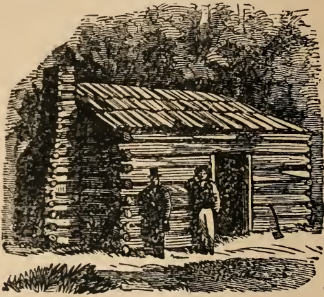
Lincoln's erstes Haus in Illinois

Eisenbahnen unbekannt waren, wurde in fünfzehn Tagen gemacht. Sie führten ihre Waaren in großen, von Ochsen gezogenen Wagen mit, und Abraham selbst trieb eines der Gespanne. Sie hielten am Nordufer des Sangamon River an einem Platze, zehn Meilen westlich von Decatur, Illinois. Während sie durch das Marschland des Kaskaskia River zogen, mußten die Männer mehrere Fuß tief durch das Wasser waten. So wurde die Reise nicht ohne Hindernisse gemacht. Bei ihrer Ankunft wurde ein Blockhaus