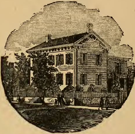
Lincoln's Haus in Springfield.

Der nächste Tag brachte nach Springfield das von der Convention ernannte Committee, um Lincoln offiziell von seiner Ernennung in Kenntniß zu setzen. Sie wurden von einer großen Masse Bürger bis zu seinem Hause geleitet. Ein Augenzeuge, der diesem denkwürdigen Besuch in dem einfachen, weißen, zweistöckigen hölzer-