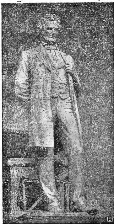
STATUA DI LINCOLN

Abramo Lincoln discese da una famiglia di Quacheri, stabilitasi nel Kentucky, in su la prima metà del secolo XVIII. Nacque il 12 febbraio 1809 ad