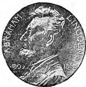
MEDAGLIA DEL CENTENARIO

Nell'agosto del 1619 una nave da guerra olandese sbarcava a Chesapeake nella Virginia, venti schiavi negri che i coloni impiantati là da poco tempo, acquistarono per averne aiuto nella lavorazione della terra. Erano, quei venti, i primi schiavi che toccavano il suolo americano e data da quell'anno lo stabilimento della schiavitù in America. Fu, allora, una necessità ed una fortuna per le colonie americane lo avere schiavi. L'emigrazione non esisteva