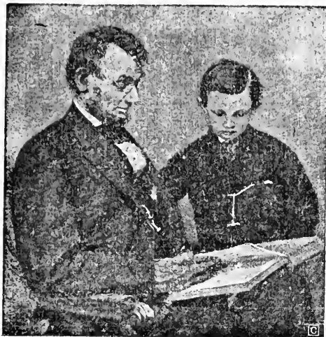
GIOVANNI LINCOLN E SUO FIGLIO.

Lincoln aveva fede assoluta nella vittoria.