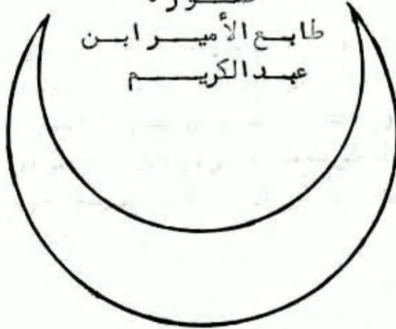
صورة طابع الأمير ابن عبد الكريم

الراية حمراء، والكتابة بداخلها بالذهب في صحن أبيض، والطيبع من فضة