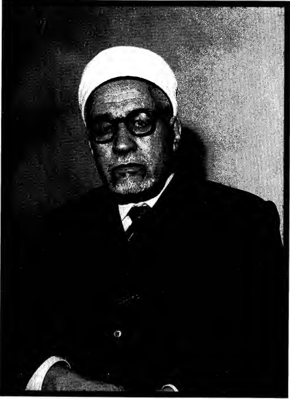
القاهرة ، 1952