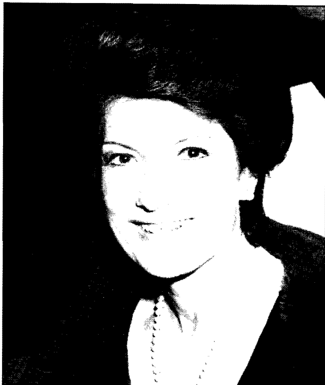
Mady Mesplé

"Dans ma douleur, qui coule goutte à goutte, un désir me vient de mourir, et de voir les rives humides de l'Acheron où fleurit le lotus, et de descendre vers Hadès" (In my suffering flowing drop by drop, the desire for death comes over me, a desire to see the moist banks of the Acheron where the lotus blooms and to descend towards Hades).