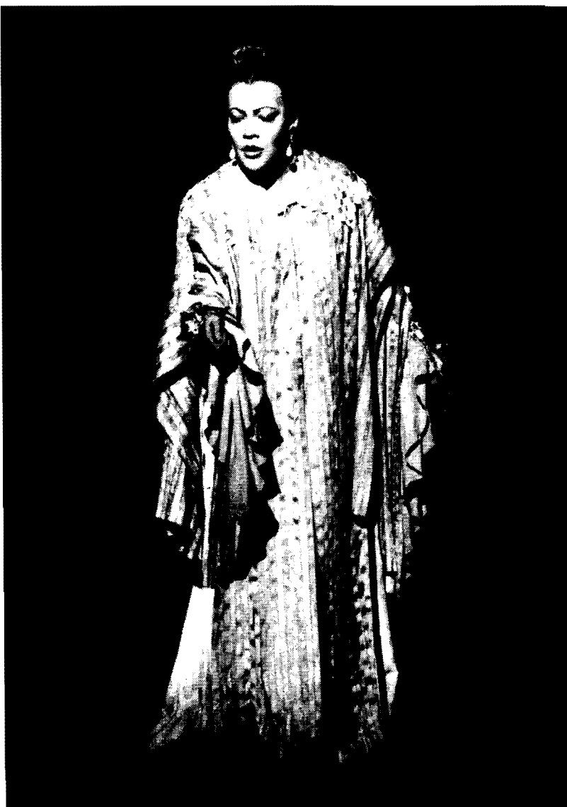
Christiane Eda-Pierre dans «Erzsebet»