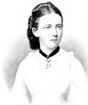
MARIE Princesse de Prusse, Fille de Prince Frédéric-Charles