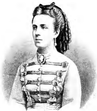
MARIE Princesse de Prusse, Duchesse de Saxe