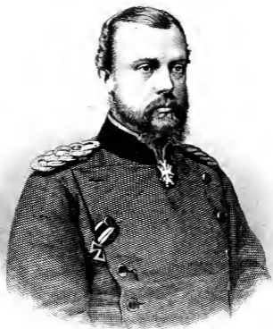
ALBERT Prince de Prusse.