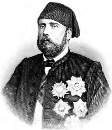
ISMAÏL - PACHA Khédive d'Égypte.