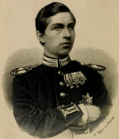
Guillaume Prince de Prusse.