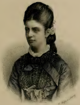
Antoinette Archiduchesse de Toscane.