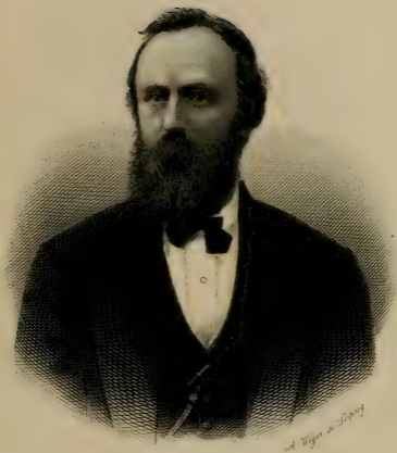
Rutherford B. Hayes, Président des États-Unis de l'Amérique du Nord