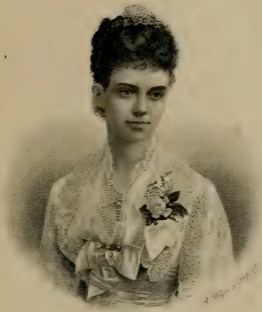
Thyra Princesse de Danemark.