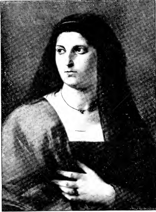
Studienkopf zum Dantebild