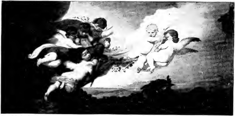
Amoretten und Pan