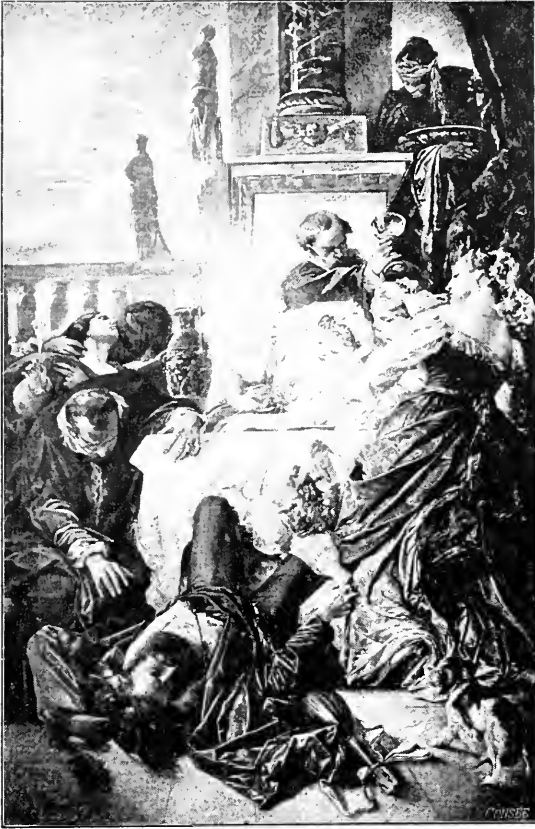
Tod des Hretino