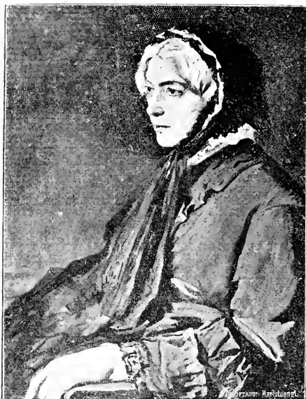
Die Mutter gemalt von Anselm Feuerbach