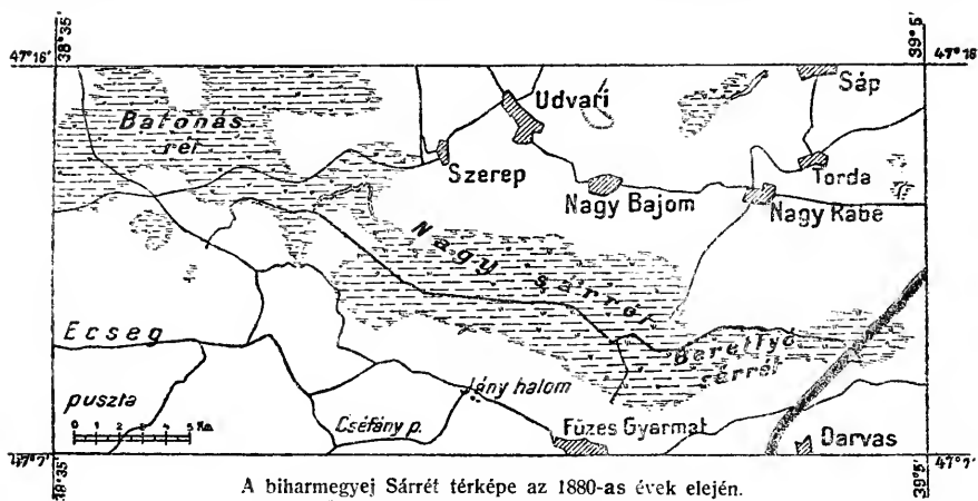
A biharmegyej Sárret térképe az 1880-as évek elején. Der Sarrét-Sumpf Anfang der 1880-er Jahren.

A Csarnába száraz időkhben kevés viz marad, de a két Halas soha ki nem szárad és ez a forrás kútfeje az egész Sárret-ének.