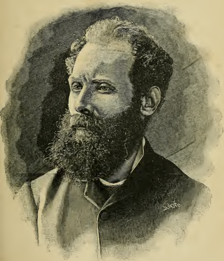
Anthero de Quental