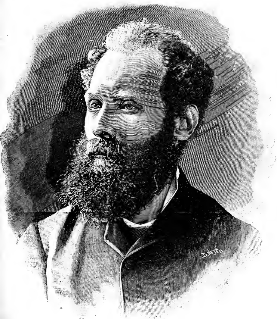
Anthero de Quental