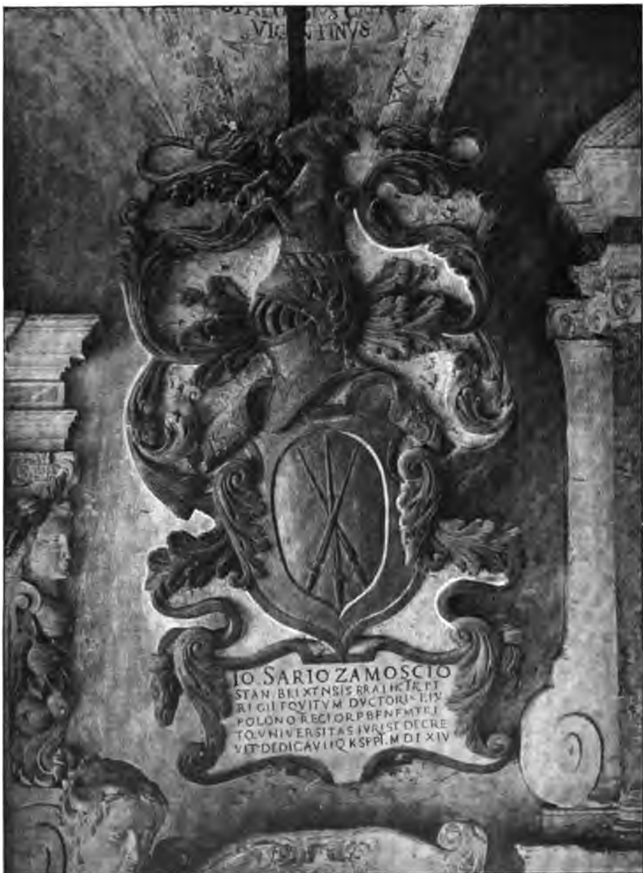
Tablica pamiątkowa I w krąganku uniwersytetu w Padwie. Podczas odnawiania gmachu w r. 1855 przez nieumiejętne wypełnienie czarną farbą liter złotobłych zepsuto następujący napis pierwotny: Ioanni Sario Zamoscio Stanislai Belsensis praefecti et regii equitum ductoris filio, Polono, Rectori benemerito universitas iuristarum decrevit dedicavitque Kalendis Septembris MDLXIV.