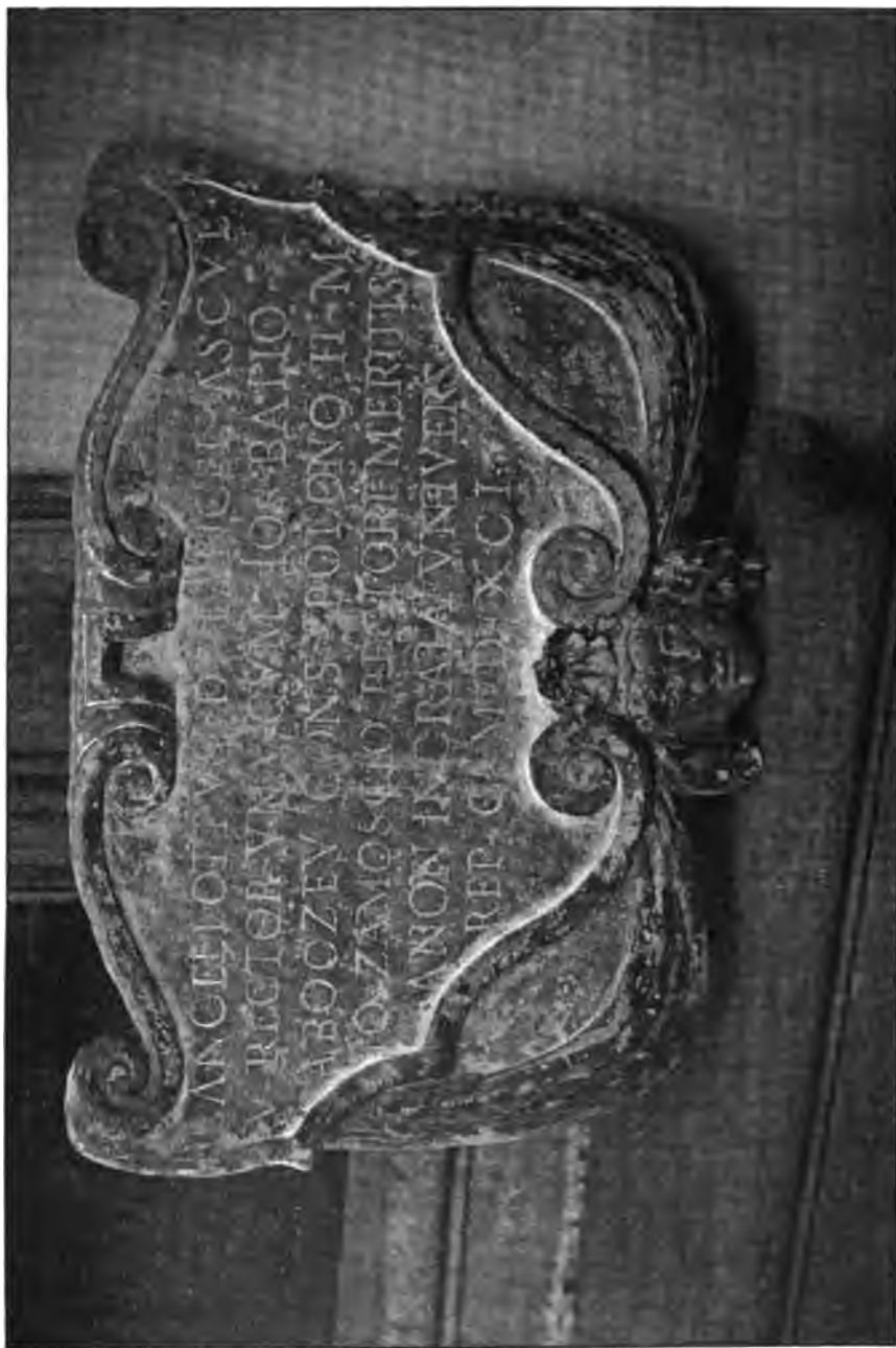
Tablica pamiątkowa II w krużganiku uniwersytetu w Padwie z następującym napisem: Lancellotus de Lancellis Asculanus Universi- tatis Rector una cum Ioanne Balio ab Ozeze consiliario Polono Illustri Magnifico Ioanni Zamocio Rectori meritisimo a non ingrata universitatis republica construxit MDXCI.