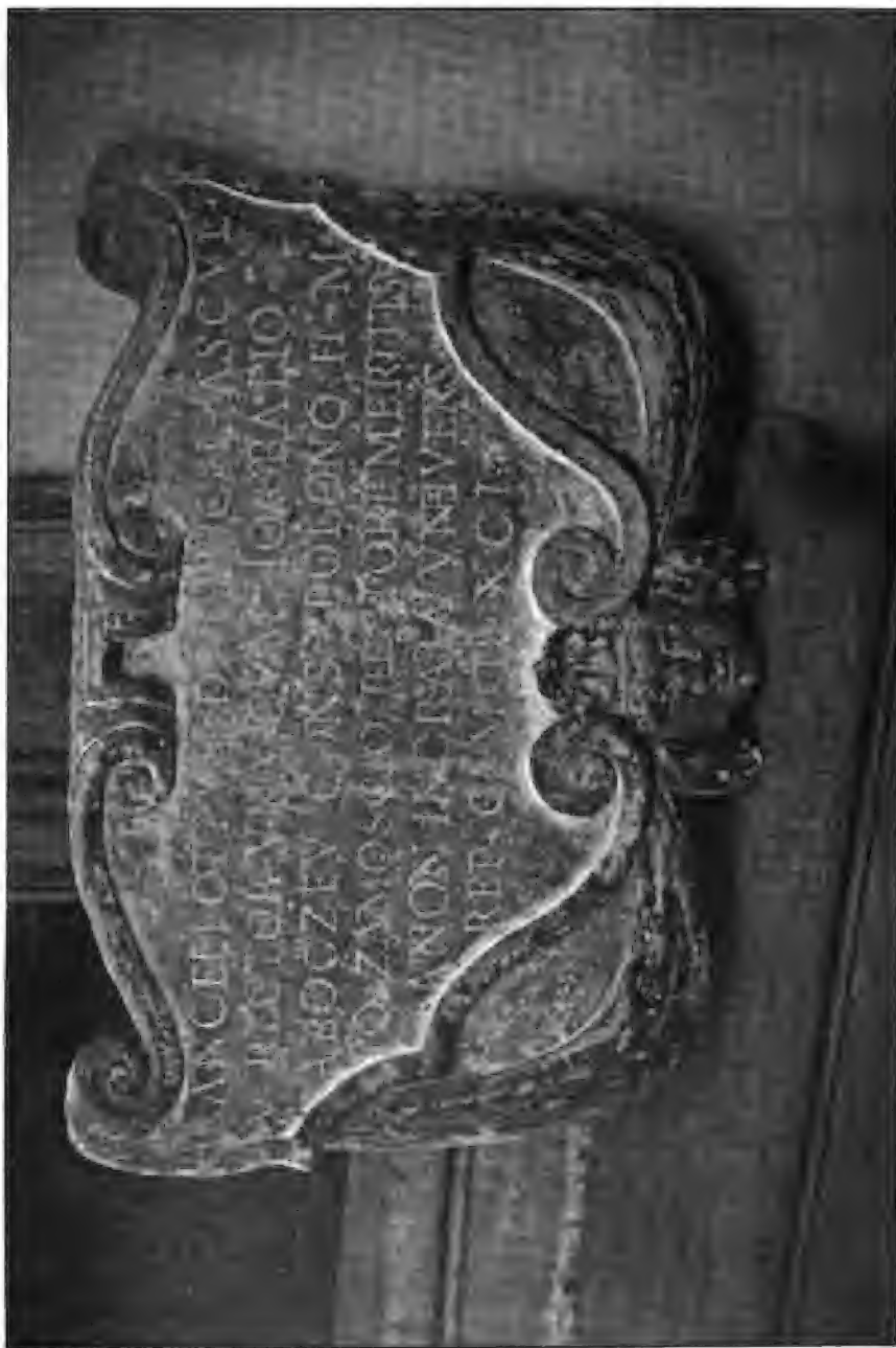
Tablica pamiętkowa II w krużanku uniwersytetu w Padwie z następującym napisem: Lancelotus de Lancellis Ascalanus Universitatis Rector una cum Ioanne Balio ab Orzev consiliario Polono Illustri Magnifico Ioanni Zamoscio Rectori meritisimo a non ingrata universitatis republica construxit MDXCI.