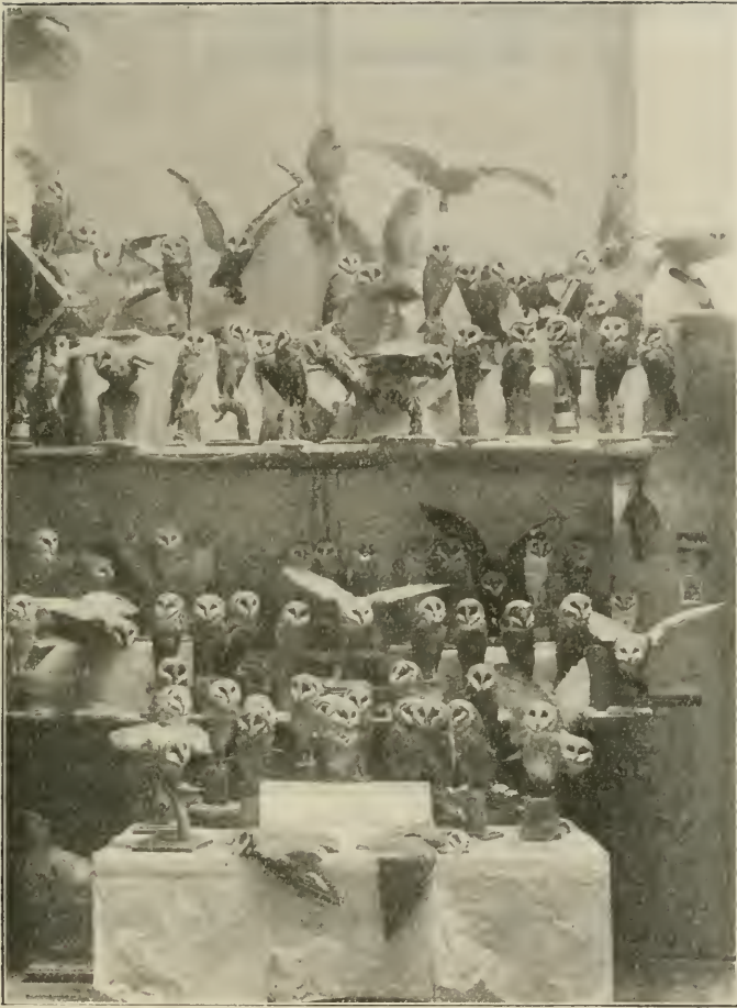
(Zie „Korte Mededeelingen” bij: Strix flammea L.)