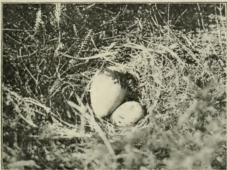
Nest en eieren van de Goudplevier ( Charadrius apricarius L.).