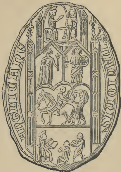
S[igillum] NACIONIS ANGLICANE