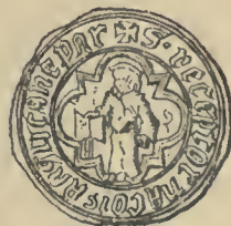
S[igillum] RECEPTOR[is] NAC[i]O[n]IS ANGLICANE PAR[isi]us