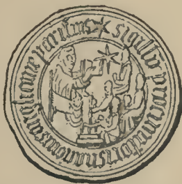
SIGILLV[m] PROCVRATORIS NACIONIS ANGLICANE PARISIVS