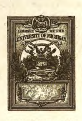
PRESENTED BY THE AUTHOR