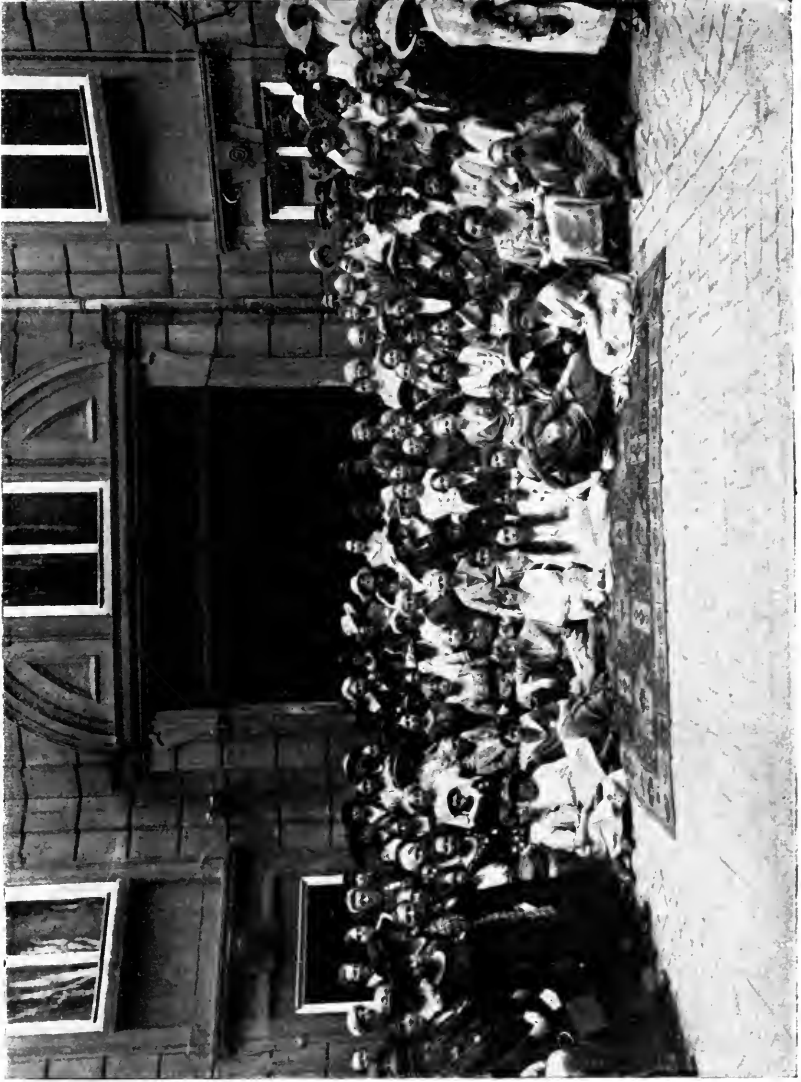
DELEGATES AND MEMBERS OF THE VIENNA CONGRESS