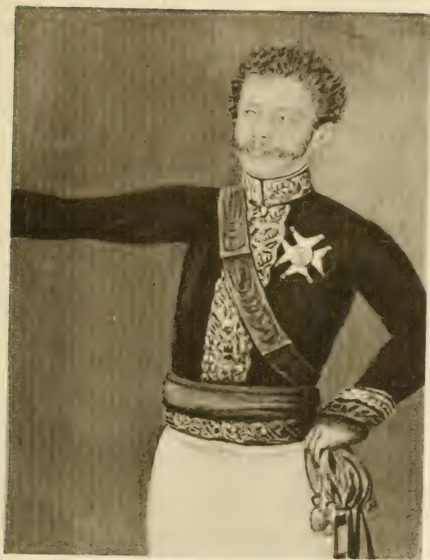
GENERAL JOSÉ DE CANTERAC