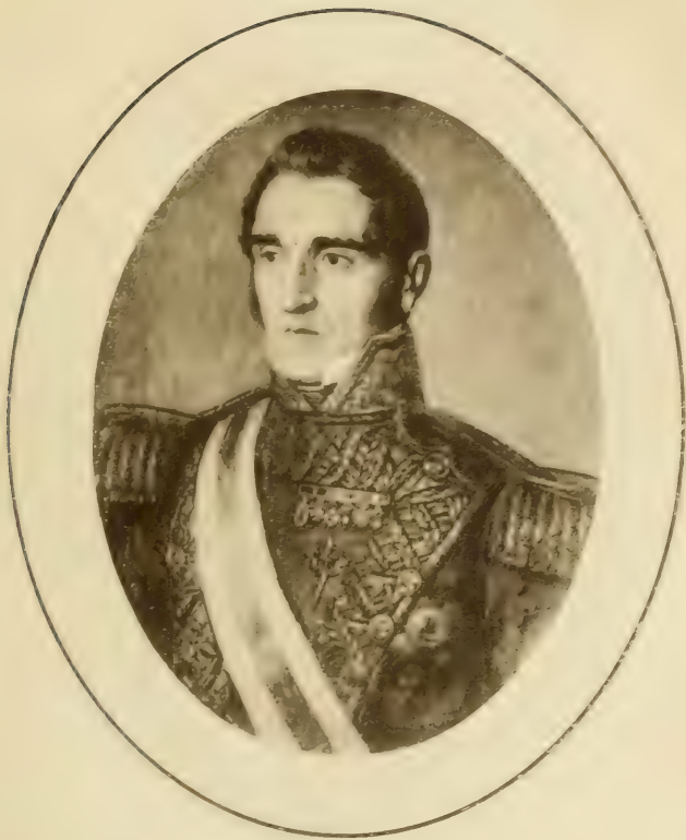
GENERAL ANDRÉS GARGÍA CAMBA