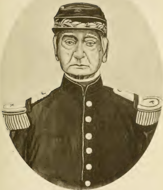
GENERAL BARTOLOMÉ SALOM