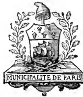
Armes de la Municipalité de Paris, en 1790.

TOME PREMIER PRÉLIMINAIRES. — ÉVÉNEMENTS