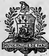
Armes de la Municipalité de Paris, en 1790.

TOME PREMIER PRÉLIMINAIRES. — ÉVÉNEMENTS