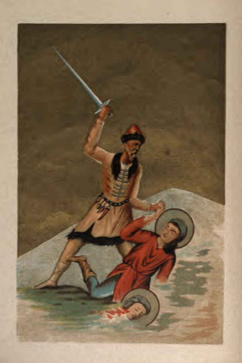
КРЪМОВЪ ВОЙНИКЪ по коженъ ракописъ отъ X—XI въкъ.