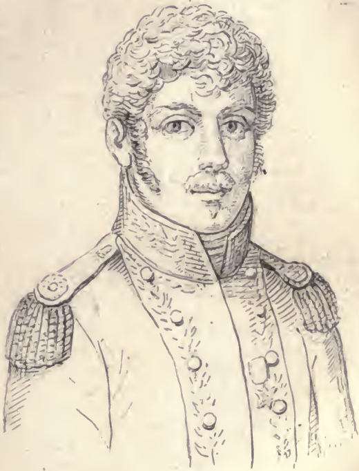
Simon Bolivar Généralissime des Indépendans