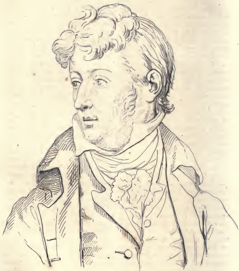
Sir Francis Burdett.