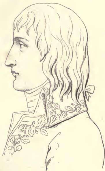
Le Général Bonaparte.