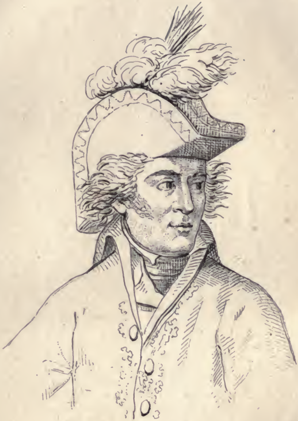
Brune. Maréchal de France.