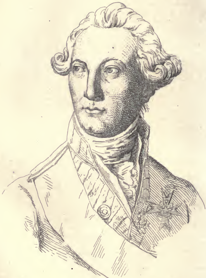
Le Général de Bouille