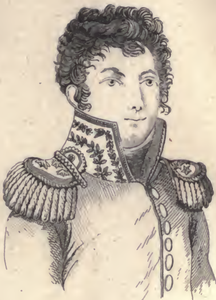
Bonchamp G nt Vendéen.