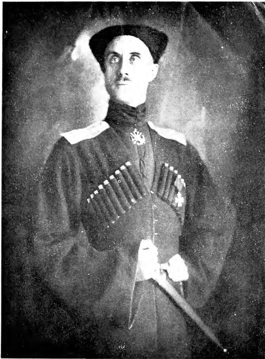
Главкомандующий Русской армией генераль баронъ Петръ Николаевичъ Врангель.