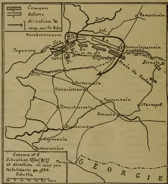
Схема N 5. Положеніе 27 декабря 1919 г. (9 января 1920 г.) и направление удара большевиковъ въ 1920 г.

27 декабря (9 января) вся армія уже была на лѣвомъ берегу Дона,*) переправившись черезъ него съ колоссальными затрудненіями. Спасли положеніе лишь наступившіе морозы, которые снова прекратились, какъ только закончилась переправа. Природа помогла своимъ сынамъ.