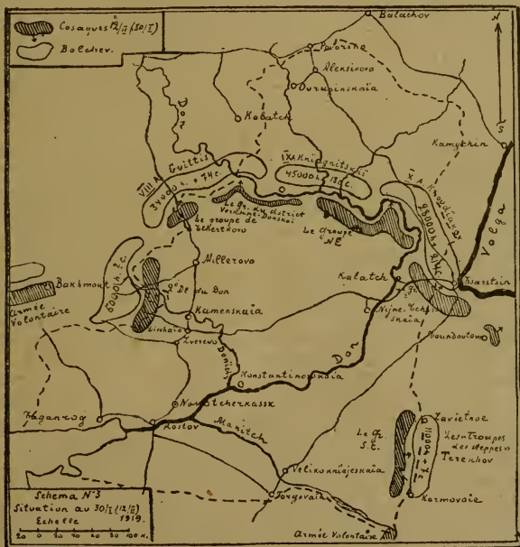
Схема N 3. Положение 30 января (12 февраля) 1919 г.

Необходимо отмѣтить, что развалу казачества на Воронежскомъ направленіи сильно помогла попытка Донского атамана организовать на этомъ направленіи, такъ называемую, „Южную армію“. Туда, какъ выяснилось особымъ разслѣдованіемъ,