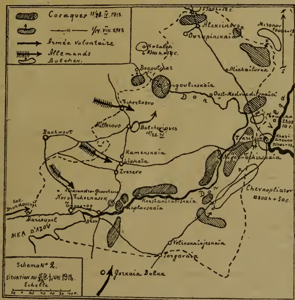
Схема No 2. Положеніе 15 (28) апрѣля и 1 (14) августа 1918 г.

сѣверной. На лѣвомъ берегу Дона, между нимъ и ж. д. Ростовъ—Тихорѣцкая, организовалась Задонская группа. Общее руководство принялъ ген. Поповъ, какъ походный атаманъ. Имѣлись свѣдѣнія, правда неточныя, о движеніи на Новочеркасскъ съ сѣвера со стороны Воронежа и съ запада со стороны Бахмута либо нѣмцевъ, либо украинцевъ, а также были точныя вѣсти о приближеніи съ юга съ Кубани Добровольческой арміи, что сильно ободрило Донцовъ.