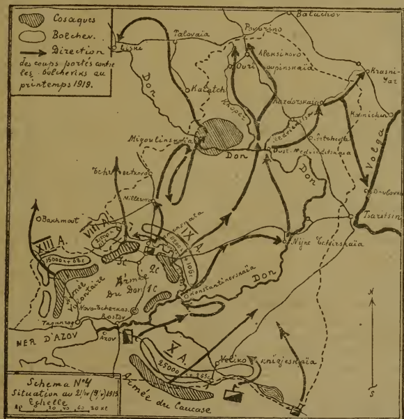
Схема No 4. Положеніе 21 апрѣля (4 мая) 1919 и направленіе ударовъ противъ большевиковъ весной 1919 г.

казской армии въ концѣ апрѣля (началъ мая) въ общемъ направленіи вдоль желѣзной дороги Торговая — Царицынъ на Царицынъ. Армія эта была вновь сформирована, и во главѣ ея сталъ генералъ Врангель, выдвинувшійся въ роли крупнаго кавалерійскаго начальника при освобожденіи отъ большевиковъ сѣвернаго Кавказа. Подъ его начальствомъ армія въ