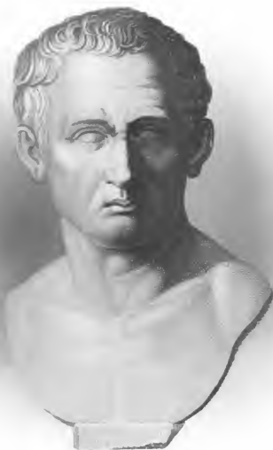
A. Wegner sculp. Leipzig