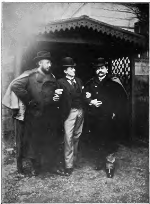
Merian Karl Kraus Liliencron