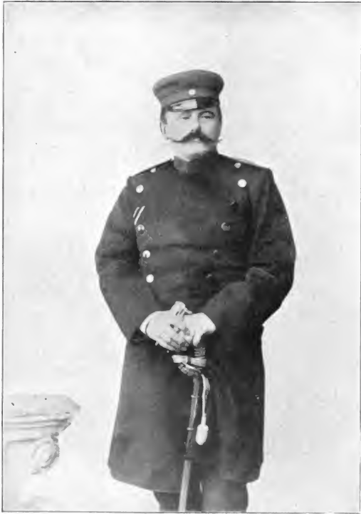
Detlev von Liliencron (1893) (Widmung auf der Rückseite)