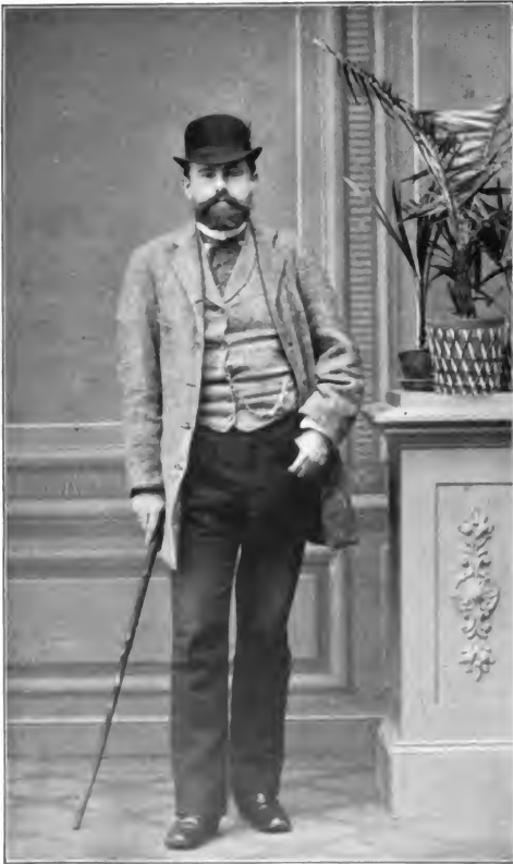
Detlev von Liliencron (Mitte der achtziger Jahre)