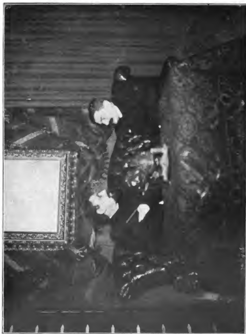
Detlev von Liliencron