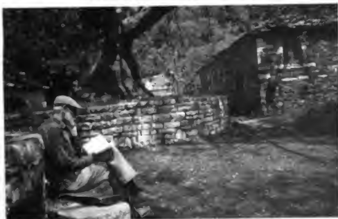
Edward Clark Crossett Professor of Humanistic Studies, Stanford University, 1977-1990