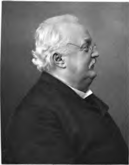
R. Ganz, Zürich phot. 1891