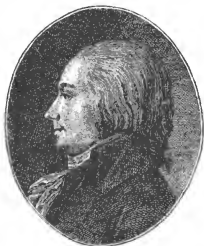
OCHS Stifter der neuen helvetischen Con- stitution und Director.